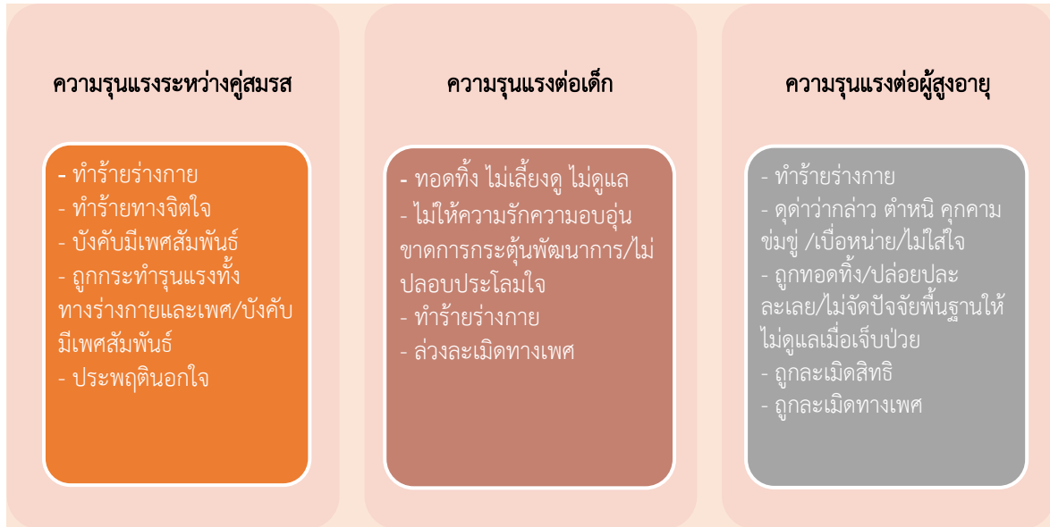
ภาพที่ ๒ ประเภทของความรุนแรงในครอบครัว

นอกจากนี้ สังคมไทยยังต้องทำความเข้าใจ ความรุนแรงต่อผู้หญิง โดยมีมุมมองในมิติหญิงชาย เนื่องจากสาเหตุของปัญหาความรุนแรงมีความเกี่ยวข้องกับอคติทางเพศ มีการเลือกปฏิบัติต่อผู้หญิงทุกช่วงวัย ทั้งเด็ก เยาวชน วัยทำงาน และผู้สูงอายุ