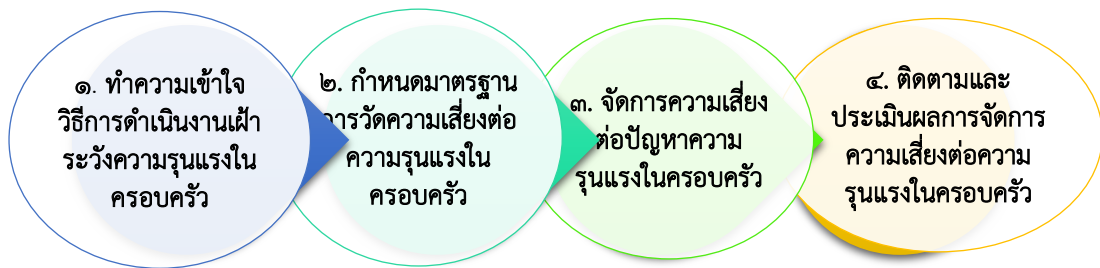
ภาพที่ ๔ กระบวนการเฝ้าระวังความรุนแรงในครอบครัว

โดยความร่วมมือในระดับชุมชนและระดับจังหวัด มีวัตถุประสงค์เพื่อประเมินความสำเร็จและถอดบทเรียนการดำเนินงาน และจัดการข้อจำกัดหรือปัญหาอุปสรรคที่เกิดขึ้นระหว่างการดำเนินงานเฝ้าระวังความเสี่ยงต่อความรุนแรงในครอบครัว ผลจากการติดตามและประเมินผลฯ จะได้บทเรียนประสบการณ์การทำงานเพื่อการเฝ้าระวังร่วมกันของเครือข่ายผู้ปฏิบัติงานเกี่ยวข้อง เพื่อเชื่อมโยงกับระบบการเตือนภัยในระดับครอบครัวและชุมชน การเตือนภัยระดับจังหวัด ตลอดจนการเตือนภัยในระดับสังคม